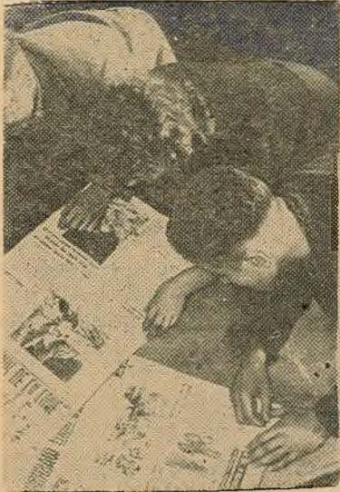
Студэнты 2 курса філалагічнага факультэта праглядаюць французскія газеты з паведамленнем аб запуску савецкай касмічнай ракеты на Месяц і паездцы М. С. Хрушчова ў ЗША.